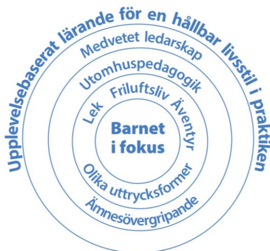
I Ur och Skurs pedagogikmodell

I Ur och Skurs pedagogik är utvecklad utifrån Friluftsförbundets barn- och ungdomsverksamhet. Pedagogiken beskrivs med hjälp av I Ur och Skurs pedagogikmodell. Pedagogikens utgångspunkt är att varje barns behov och intressen ramar in av ett upplevelsebaserat lärande för en hållbar livsstil i praktiken. Nedan följer en beskrivning av I Ur och Skurs pedagogikmodell.